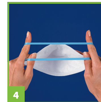
4 Séparer les deux bandes élastiques à l'aide de vos index et de vos pouces.