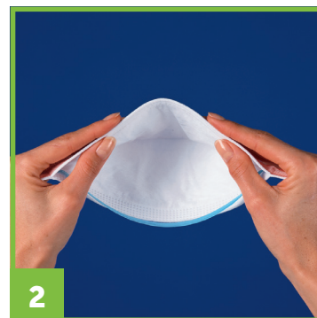
2 Plier légèrement la barrette nasale pour lui donner une forme concave.