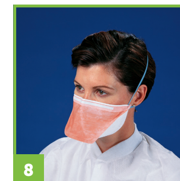
8 Placer l'autre élastique sur le sommet de votre tête.