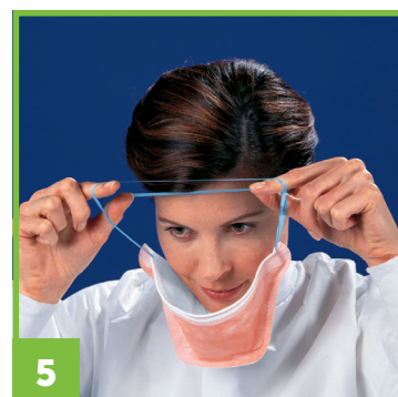
5 Placer le masque en creux sous le menton en maintenant les bandes élastiques avec les index et les pouces.