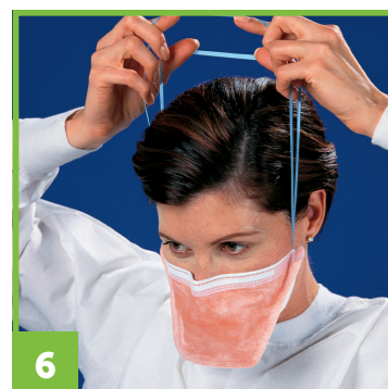
6 Remontez les serre-tête vers le dessus de votre tête.