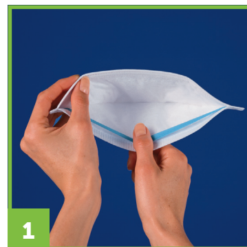
1 Écarter les bords du masque de manière à l'ouvrir complètement.