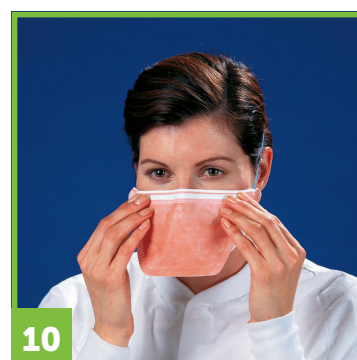
10 Continuer à ajuster le masque et à positionner les bords jusqu'à ce qu'ils tiennent bien au visage. Maintenant, vérifiez l'étanchéité du respirateur.