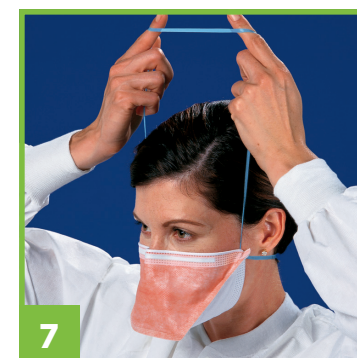
7 Positionner l'élastique inférieur retenu par vos pouces à la base du cou.