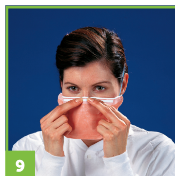
9 Appuyez fermement sur la barrette nasale afin que celle-ci s'ajuste à la forme de votre nez.